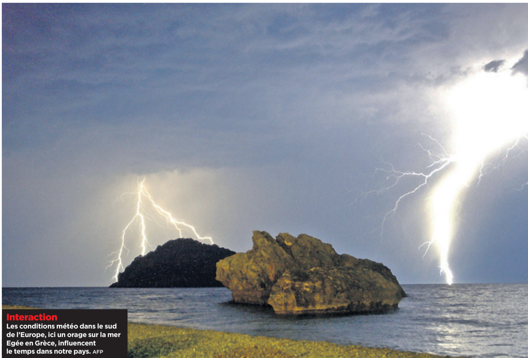
Interaction Les conditions météo dans le sud de l'Europe, ici un orage sur la mer Egée en Grèce, influencent le temps dans notre pays.

Ces conclusions sont basées sur l'analyse de plus de soixante ans de données de précipitations et de températures provenant de plus de 200 stations météorologiques européennes. Pour l'instant, les scientifiques ne peuvent toutefois pas dire précisément si les Suisses ou les Français devraient se pencher sur le printemps grec, italien ou espagnol pour prédire leur été. «Notre modèle doit encore être peaufiné, admet Benjamin Quesada. Mais nous pouvons déjà dire à 80% que, lorsque l'hiver et le printemps sont vraiment humides au bord